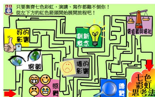
「七色彩虹思考法」學習圖卡